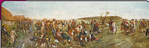
Faimoasa lucrare a lui Ștefan Jäger: „Die Einwanderung der Schwaben ins Banat” - „Emigrarea șvabilor în Banat”.

La începutul secolului XX, Jäger era deja bine cunoscut. În 1906 pictează prima sa mare lucrare, „Colonizarea șvabilor” („Die Einwanderung der Schwaben”), coman-